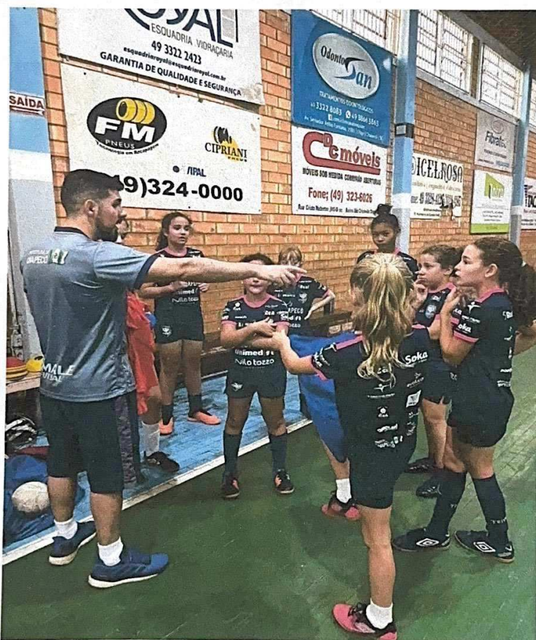
ESCOLA DE FORMAÇÃO NO BAIRRO SÃO CRISTOVÃO